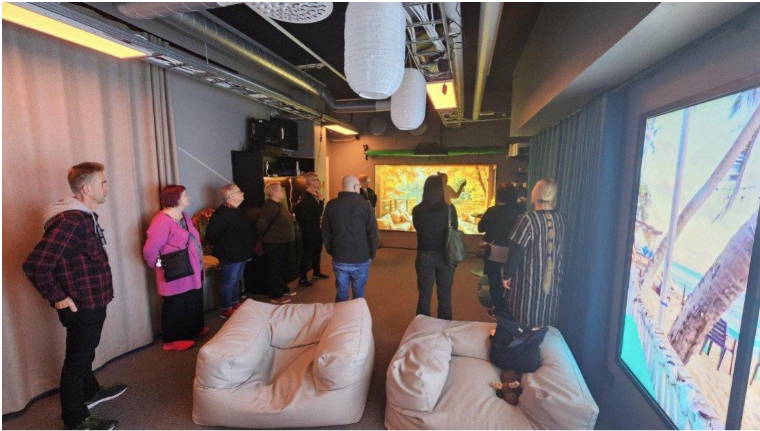
Yleiskokouksen yhteydessä pääsimme tutustumaan SAMKin hyötypeli- ja elämyslaboratorio Peliselliin.

Tutustu vuoden 2026 toimintasuunnitelmaan