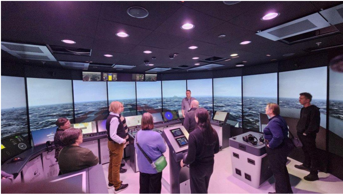
Xamkin uudella Kotkan kampuksella pääsimme tutustumaan uuteen Merenkulun simulaatioympäristöön.